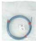
Tubería en PB en rollo de 10 m