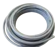
Tubería en PB en rollo de 50 m